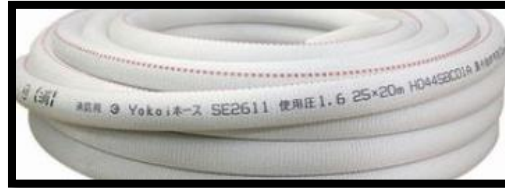
消防用保形ホース

平成 25 年 3 月 27 日以前に建てられた防火対象物の「消防用ホース」で、検定対象機械器具等 (<検>マークのあるもの) については、以下の表に従い 令和 9 年 4 月 1 日 までに自主表示対象機械器具等 (<消>マークのあるもの) に交換が必要です。