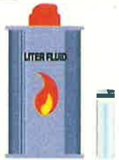
ライター・オイル