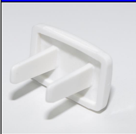
コンセントキャップ