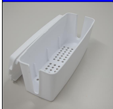
電源タップ収納ボックス