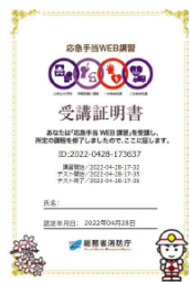
(旧コンテンツ受講証明書)

※令和5年3月まで公開していた旧コンテンツから発行された受講証明書と同等の証明書です。